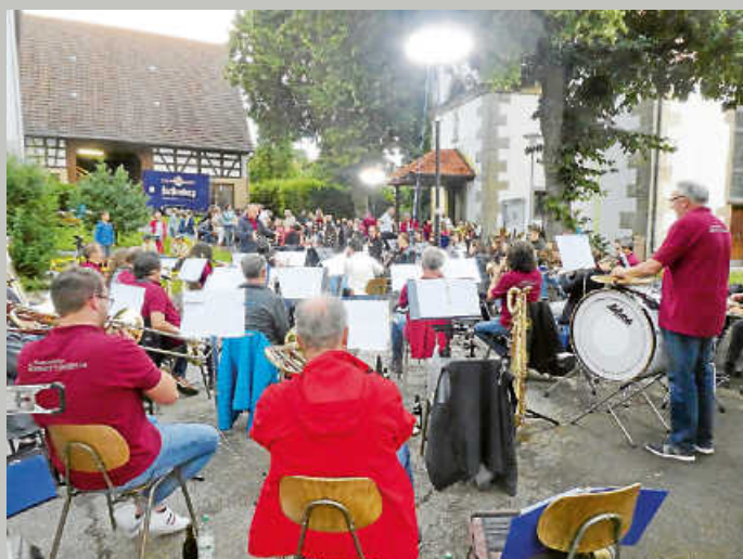
So schön war es im Jahr 2021