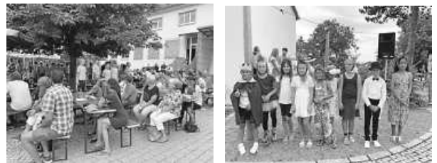
Im Schulhof Fotos: Schlossbergschule Hühnermusical

Das Schulfest war ein voller Erfolg und wir bedanken uns bei allen Eltern, Schülern, Kollegen und Gästen für die tatkräftige Unterstützung und das schöne Miteinander.