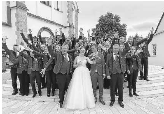
Die ganze Kapelle freut sich mit dem Brautpaar.