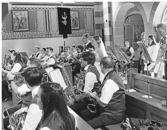
Die Braut zieht an der Seite ihres Vaters in die Kirche ein.