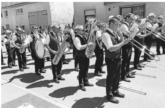
Gemeinsam mit den Kameraden aus Binsdorf spielten wir in Stetten den Umzug.