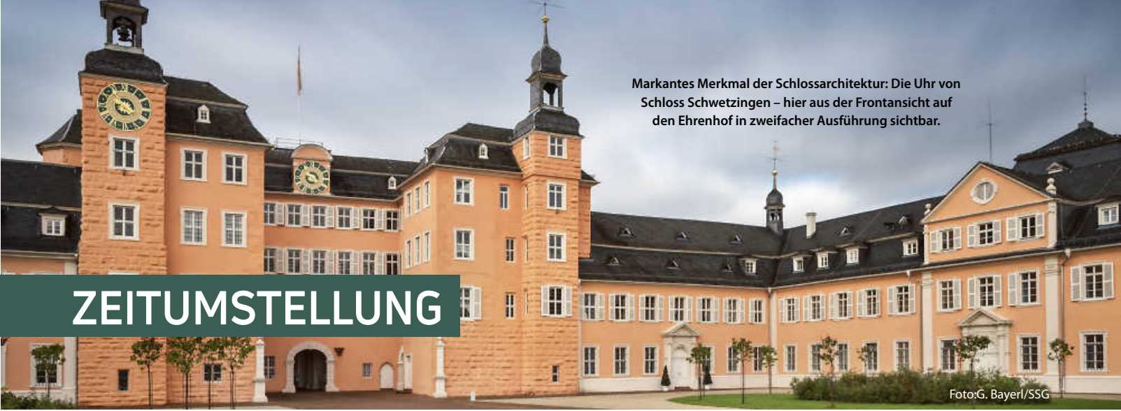
Markantes Merkmal der Schlossarchitektur: Die Uhr von Schloss Schwetzingen – hier aus der Frontansicht auf den Ehrenhof in zweifacher Ausführung sichtbar.