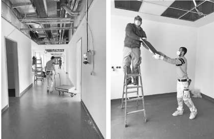
Die Umbaumaßnahmen haben begonnen: hier die Räume der zukünftigen Palliativstation

Tübinger Str. 30 72336 Balingen Tel.: 07433 9092-2013 kommunikation@zollernalb-klinikum.de