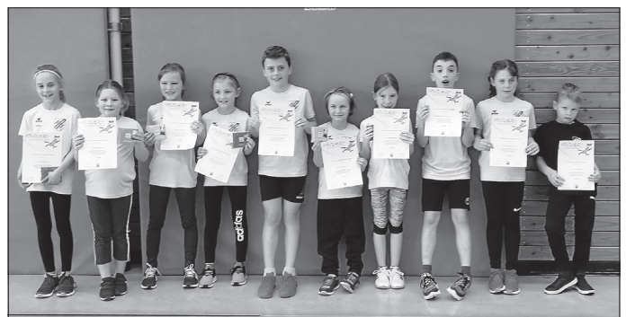
Team U10 und Team U12